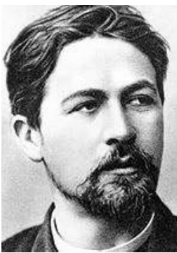
Anton Tchekhov (1860-1904)

Né à Taganrog en Russie le 29 janvier 1860, Anton Pavlovitch Tchekhov étudie la médecine à l'université de Moscou et commence à l'exercer à partir de 1884. Se sentant responsable de sa famille venue s'installer à Moscou après la faillite du père, il cherche à augmenter ses revenus en publiant des nouvelles dans divers journaux. Le succès arrive assez vite, en même temps que les premiers effets de la tuberculose qui le contraint à de nombreux déplacements pour trouver un climat plus adapté à sa santé fragile.